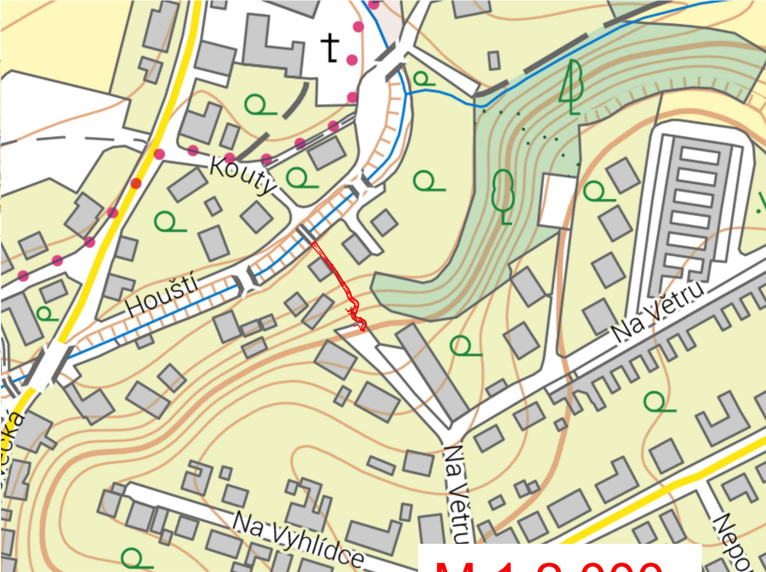
M 1:2 000