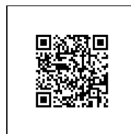
Zažádejte o vytyčení